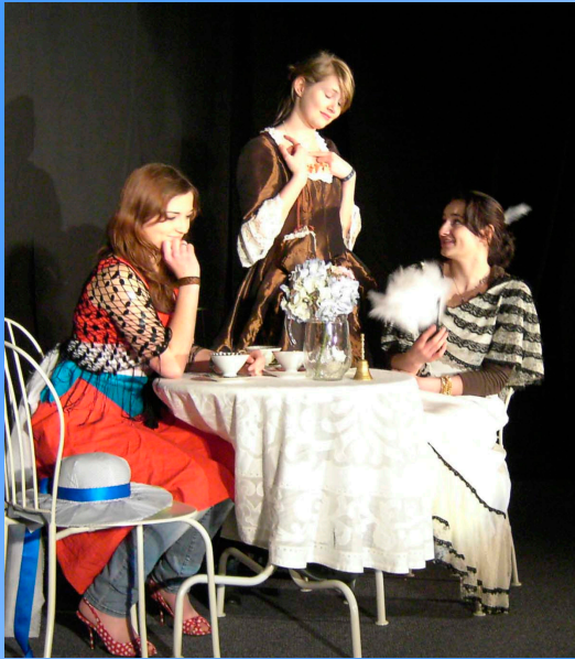
Theater-AG: „Die Irre von Paris“