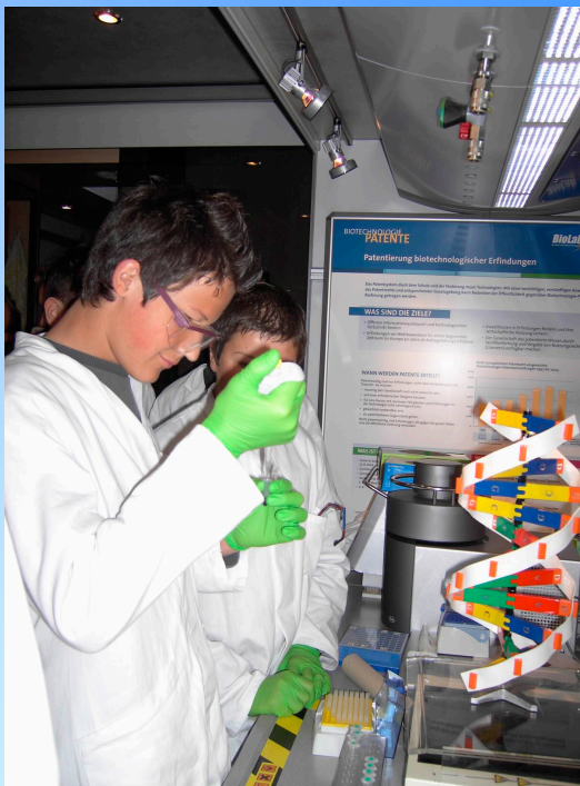
BioLab an der Falkenrealschule